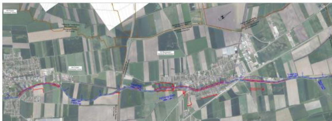
Abbildung 2: Übersichtslegeplan Trumau – Münchendorf, Bezirk Baden und Mödling