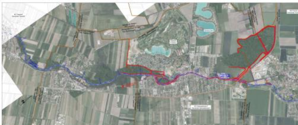
Abbildung 1: Projektgebiet Übersichtslegeplan Oberwaltersdorf – Trumau, Bezirk Baden

Das Vorhaben besteht nicht aus einem räumlich zusammenhängenden Schutzsystem. Die in den drei Verbandsgemeinden geplanten Schutzbauwerke sind voneinander räumlich getrennt, weisen allerdings einen funktionalen Zusammenhang auf. Die geplanten Rückhaltebecken bewirken eine Reduktion des HW-Abflusses der Triesting, welcher schließlich die Bauwerksoberkanten der linearen Schutzmaßnahmen definiert.