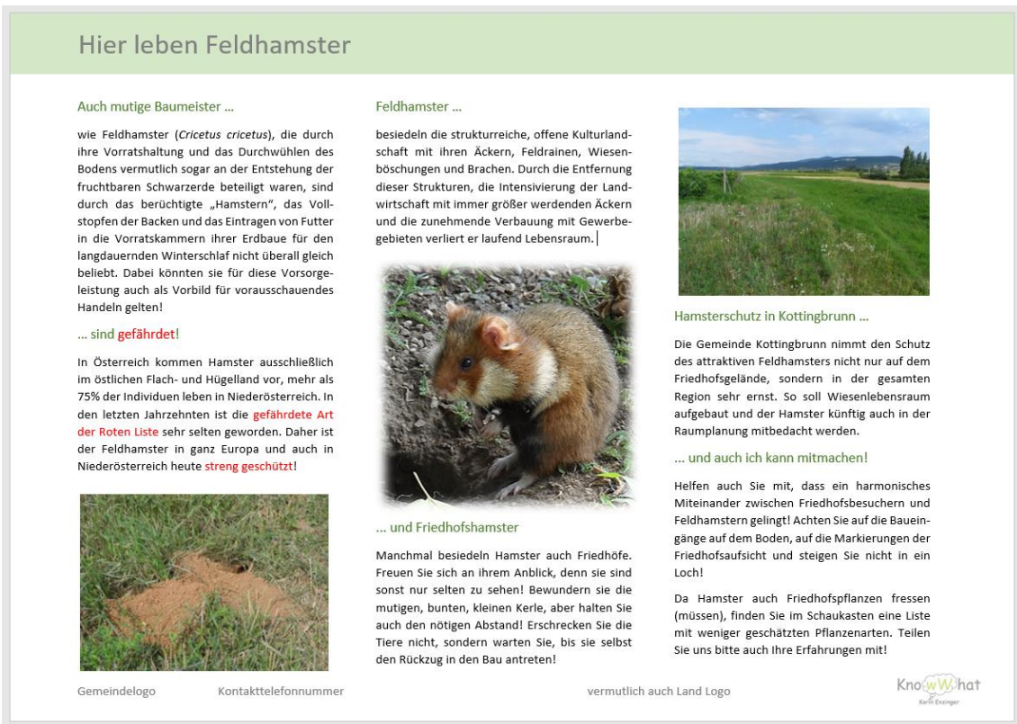
Abb. 5: Vorschlag für eine Infotafel auf dem Friedhof Kottlingbrunn