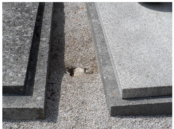
Abb.1: Lebensraum auf dem Friedhof Kottingbrunn und Baustandorte des Hamsters