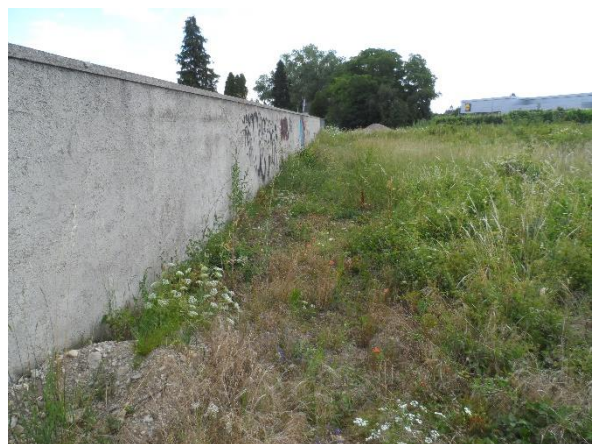
Abb.2: Südliches und westliches Friedhofsumfeld (Verbindung zum Agrarland)