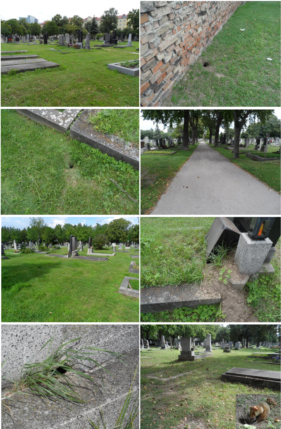
Abb.3: „Stadthamster“-Lebensraum Friedhof Meidling und Baustandorte