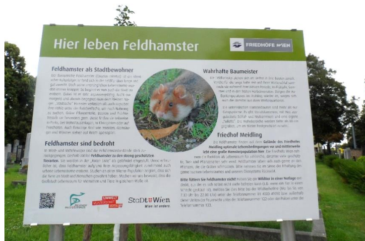
Abb. 4: Beispiel für eine attraktive Infotafel (Infotafel zum Feldhamster auf dem Friedhof Meidling)