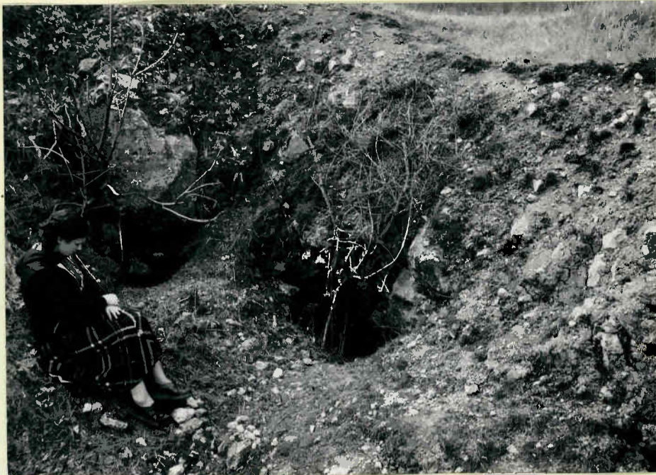
Eingang der Klawterbrunnerhöhle