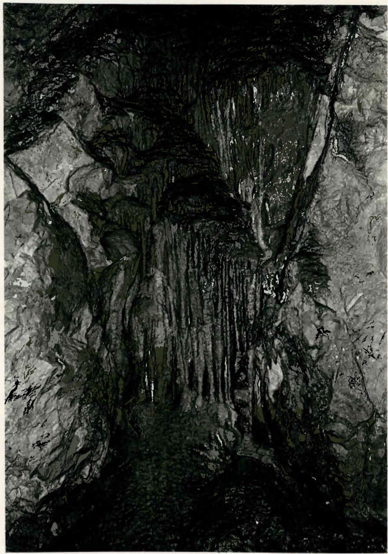
Tropfsteinfiguren in der Schichthalle

Die ursprünglich vorhandene Fortsetzung des Vorhanges im rechten Bildteil ist durch Sickerwasserkorrosion und Tropfwassererosion fast zur Gänze abgetragen und zerstört worden.