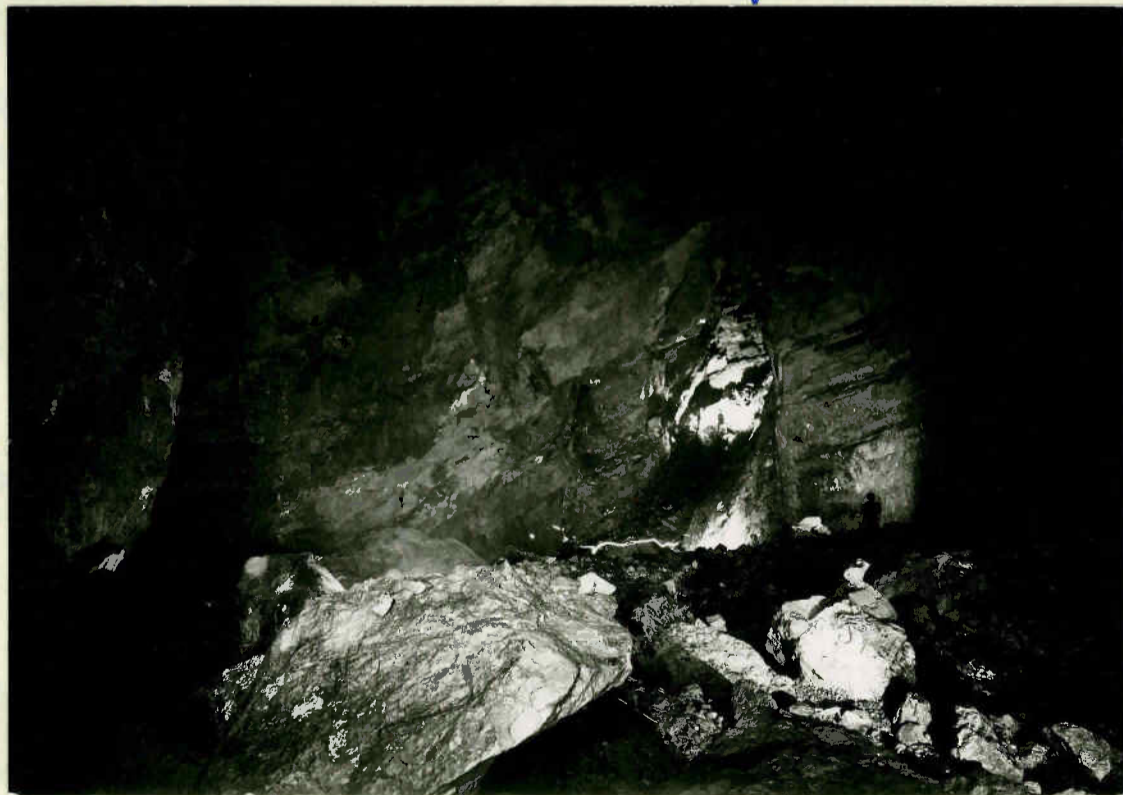
Großer Dom Blick quer durch die Halle gegen die Seekluft. Die Personen in der Hallenmitte rechts und im Hintergrund der Halle (Schnittpunkt der Pfeilrichtungen) zeigen die Raumgröße.