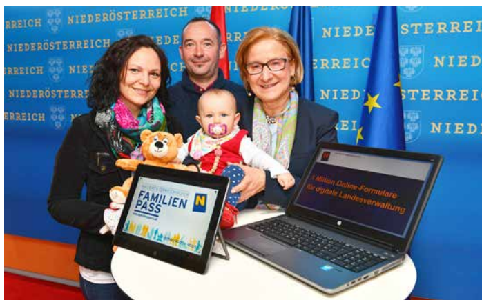
Beim Land NÖ wurde vor kurzem das „1 Millionste Online-Formular“ beantragt: Im Bild Landeshauptfrau Johanna Mikl-Leitner mit den Antragstellern des kostenlosen Familienpasses - Familie Pechhacker aus Ybbsitz.