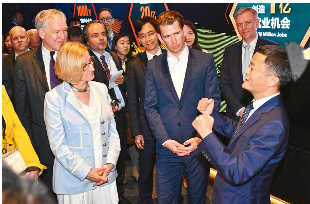
Der Gründer von „Alibaba“, Jack Ma, im Gespräch mit Landeshauptfrau Johanna Mikl-Leitner und Bundeskanzler Sebastian Kurz.

Bundeskanzler Kurz zeigte sich „froh darüber, dass es einen guten Austausch zwischen China und Österreich gibt“ und auch froh über die regionale Zusammenarbeit: