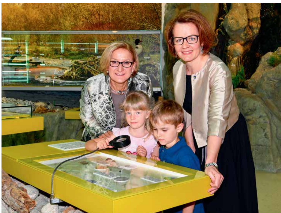
Neue Richtlinien für die Förderung der NÖ Kinderbetreuung.